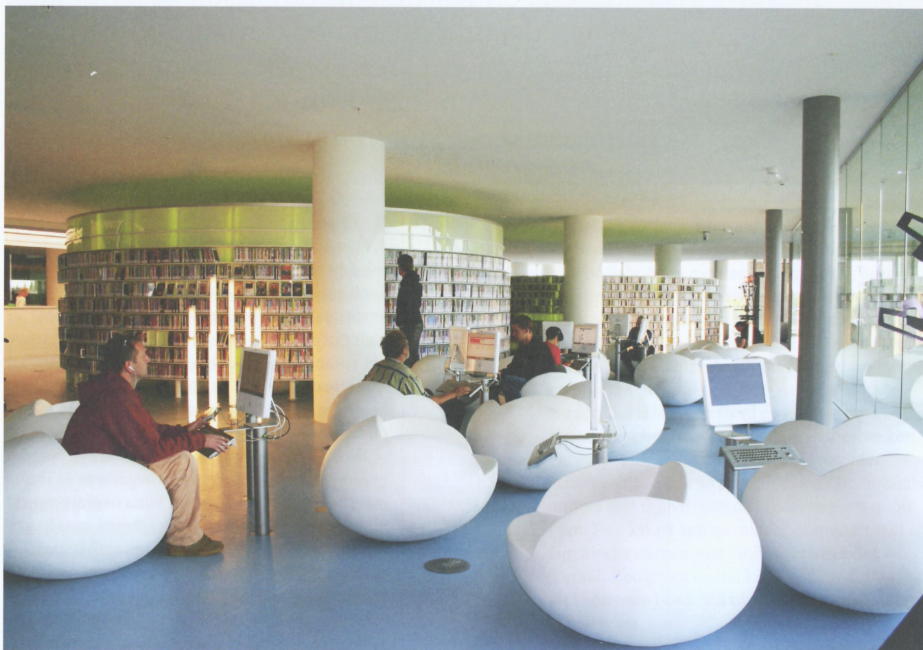
Afdeling multimedia van de Openbare Bibliotheek Amsterdam.